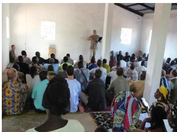
Figura 4 – Apresentação do Novo Testamento à Igreja local – seis de março de 2011.

Conforme as traduções continuavam a ser feitas, folhetos e livros da Bíblia eram lançados e distribuídos, estes geraram e abriram portas que foram duradouras, muitas vezes pessoas que andavam de distancias enormes para buscar os livros com os missionários. As traduções aconteciam sempre na língua Sussu, mas usando dois alfabetos, o Latino e o Árabe, como a maioria da população era islâmica e a leitura do alcorão era mandatária, houve cuidado na produção dos folhetos e posteriormente dos livros bíblicos, para que as edições com ambos os alfabetos possuíssem a mesma edição, número de páginas e palavras, para que a leitura fosse realizada em conjunto sem perda de comunicação. A entrega e distribuição dos folhetos, livros e fitas cassete foram uma porta que ninguém poderia mensurar, os livros da Torá, Salmos e Evangelhos são tidos como sagrados pelo próprio Alcorão Islâmico e assim, ao entregarem a Bíblia partida conforme mencionada pelo livro árabe, atingiam o fundo do coração dos locais, visto o respeito e dedicação para com a sua cultura. Paulo e Heather então entregaram incontáveis quantias de cópias, e dessa forma o Evangelho foi sendo propagado sem que nenhuma pessoa estivesse com total controle de quem estava tendo acesso a Palavra. 8